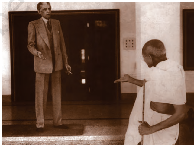
जिन्ना और गांधी

जिसे सांप्रदायिक समस्या कहा जाता था, वह अल्पसंख्यकों के अधिकारों के साथ इस तरह तालमेल बैठाना था ताकि उन्हें बहुसंख्यकों के खिलाफ़ पर्याप्त संरक्षण मिल सके। भारत के अल्पसंख्यक यूरोप की तरह जातीय या राष्ट्रीय अल्पसंख्यक नहीं, वे धार्मिक अल्पसंख्यक हैं। जातीय दृष्टि से भारत में एक विचित्र मिश्रण है, पर जातीय सवाल भारत में न कभी उठे हैं न उठ सकते हैं। धर्म इन जातीय विभिन्नताओं के ऊपर है। जातियाँ या तो एक दूसरे में मिल जाती हैं या उनमें अंतर करना कठिन होता है। ज़ाहिर है कि धार्मिक दीवारें स्थायी नहीं होतीं और जो व्यक्ति अपना धर्म बदलता है उसकी जातीय पृष्ठभूमि या उसकी जातीय और भाषिक विरासत नष्ट नहीं हो जाती। परंतु राजनीतिक मामलों में, धर्म का स्थान सांप्रदायिकता ने ले लिया है। यह एक संकीर्ण समुदाय